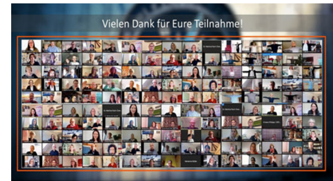
Teilnehmer der 23. DBVC Mitgliederversammlung via Zoom

Wir danken allen Mitgliedern für ihr Engagement und sind froh und auch ein wenig stolz, dass unser gemeinsamer Einsatz und unser Zusammenhalt in diesen Zeiten zu einem kulturprägenden Merkmal im DBVC geworden ist. Die erste Online-Mitgliederversammlung hat ein Format gestellt, indem die DBVC Dialogkultur auch digital gelebt werden kann.