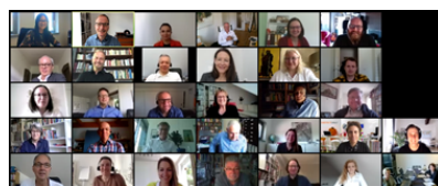
TeilnehmerInnen der DBVC Dialogkonferenz

Die DBVC Dialogkonferenz ist ein jährliches Treffen der LeiterInnen aller DBVC Gremien und Arbeitskreise: Vorstand, Präsidium, Fachausschüsse, Regionalgruppen, Sachverständigenrat und temporäre Arbeitskreise. Das diesjährige, sechste Treffen fand Corona bedingt als Videokonferenz via Zoom statt, am 26.05.2020. Im Vordergrund der Konferenz standen die Themen „Fortbildung für DBVC Mitglieder“ und Entwicklungen des IOBC e.V.