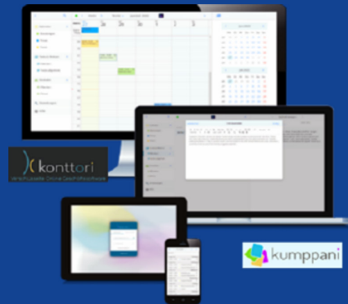
Die verschlüsselte Online-Geschäftssoftware konttori und Praxissoftware kumppani bieten eine mobile Lösung für Selbstständige und Kleinpraxen, die sensible Daten verwalten müssen. Quelle: Dr. Thomas Naujokat